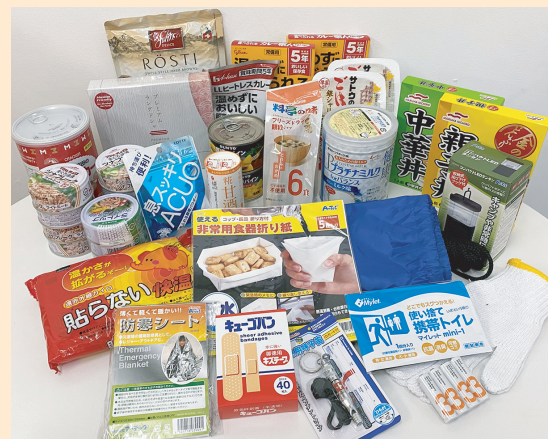
初回の発送は、災害への備えが中心です。