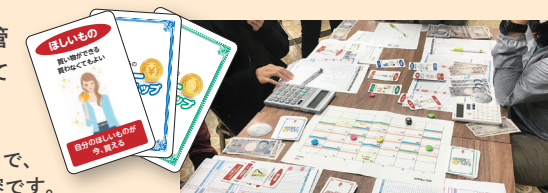
カード形式のゲームで、取りみやすい内容です。

社会的養護の下で暮らす子どもがお金の管理について学ぶためのレクチャーを行っています。