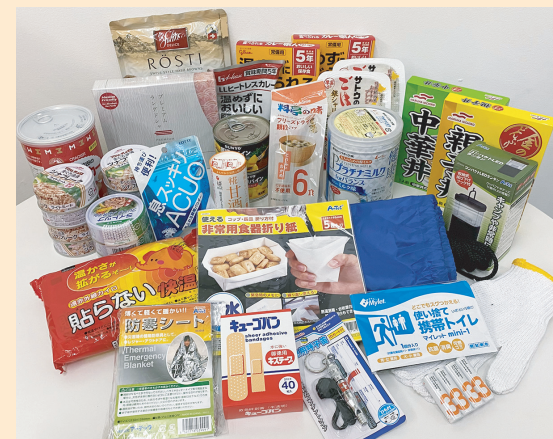
初回の発送は、災害への備えが中心です。