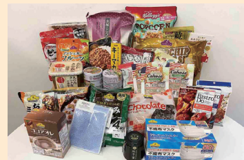
2回目以降は食品が中心です。